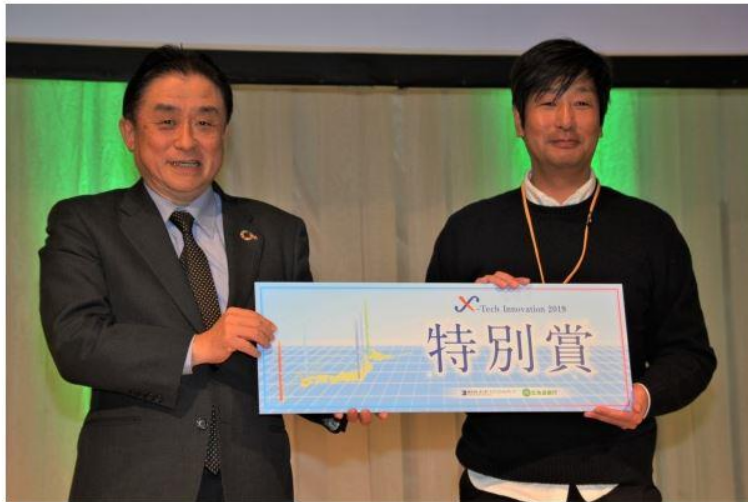
X-Tech Innovation 2019 北海道最終選考会「特別賞」受賞