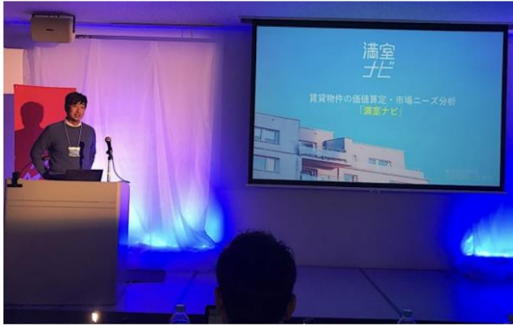
Nomaps NEDO Dream pitch 「優秀賞」受賞